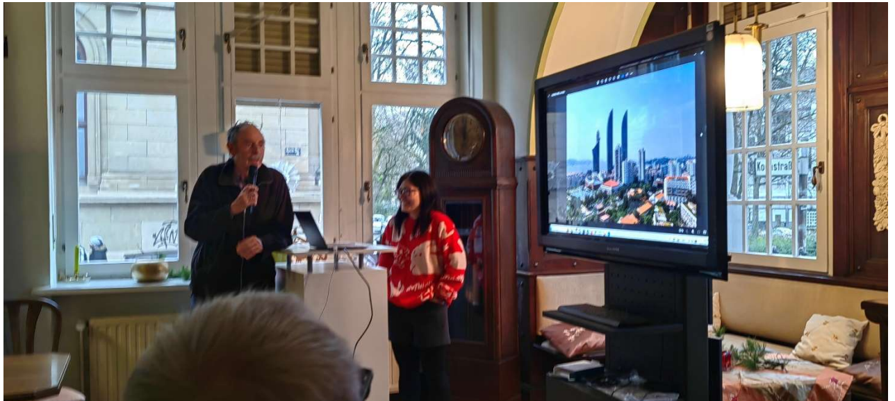
图 3 外方院长卜松山教授介绍厦门新貌