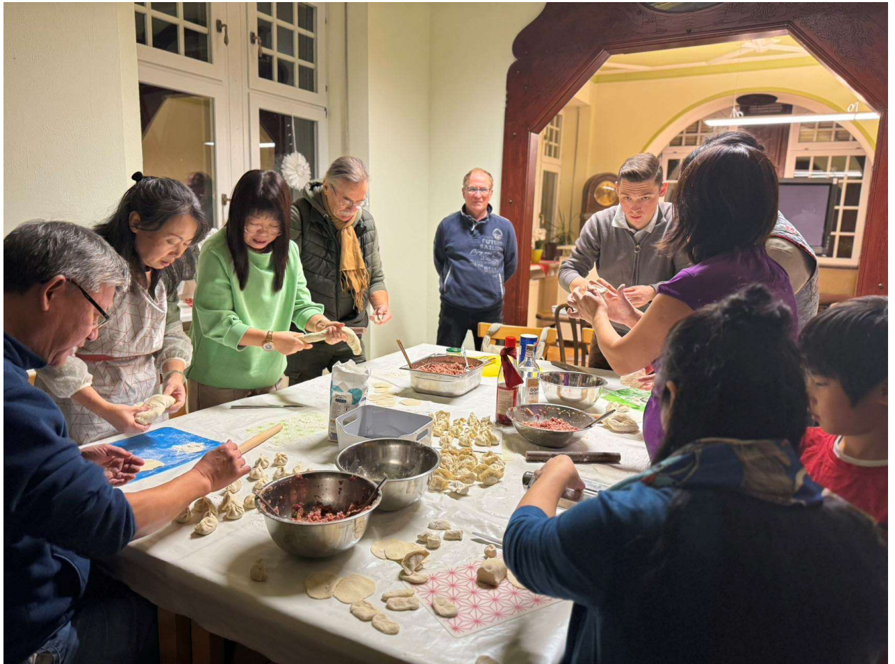
图 7 会后大家一起其乐融融包饺子